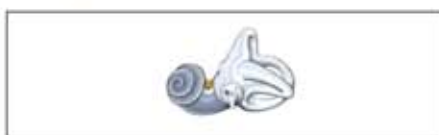
Este es el tamaño original de su órgano del oído interno This is the original size of your inner ear organ