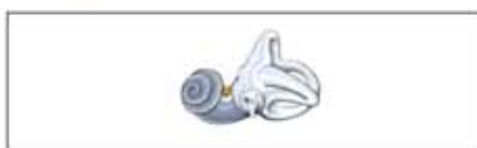
Este es el tamaño original de su órgano del oído interno This is the original size of your inner ear organ