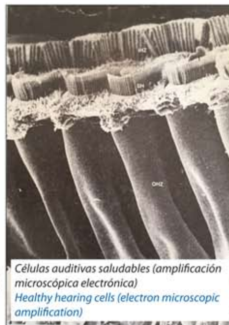
Células auditivas saludables (amplificación microscópica electrónica) Healthy hearing cells (electron microscopic amplification)

The proof of the biostimulative effectiveness of a well carried-out LLLT of the ears, is the improvement of the person's hearing capacity, measured by audiometric tests