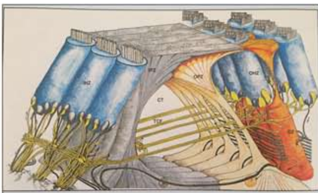
Gráfico de las células auditivas / Graphic of hearing cells

demuestran cómo funciona este proceso biológico. La luz láser en las células produce más energía celular (ATP), lo que permite a las células recuperarse del agotamiento celular. El resultado para nuestros oídos es una mejora muy notable y medible del proceso de sanación de nuestro oído interno. Cada vez más personas, incluyendo a cada vez más niños y niñas, sufren de pérdida de audición, presión en el oído, hiper o hipoacusia, tinnitus, vértigo o Morbus Meniere. Por tanto, es una excelente noticia el poder contar con la posibilidad en Ibiza de recurrir a la Terapia Láser de Bajo Nivel para ayudar a sanar los órganos del oído interno.