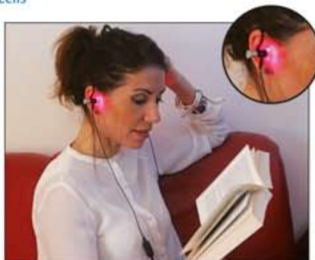
Terapia en casa con nuestro Lux Spa Home Laser del Dr. Wilden / Láser de oído interno The Home Therapie with our Lux Spa Home Laser by Dr. Wilden / Inner Ear Laser